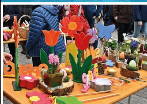
Ostermarkt in Gaggenau mit Kunsthandwerk