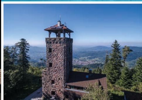
Große Loffenauer Runde