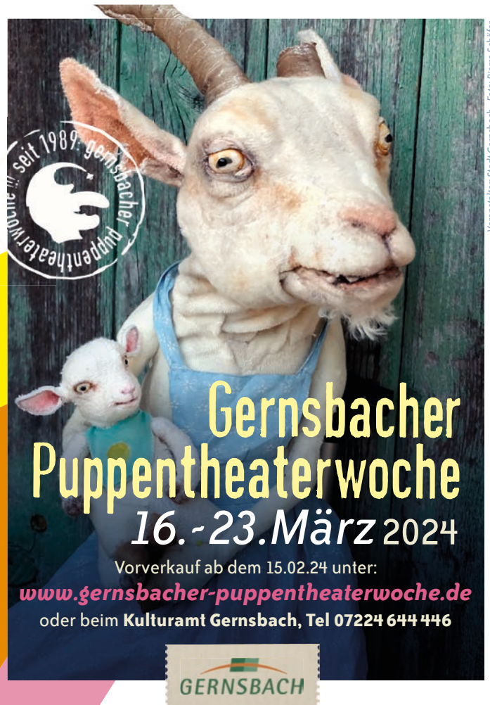
Veranstalter: Stadt Gernsbach

Der Kartenvorverkauf beginnt an allen nachstehend genannten Vorverkaufsstellen am Donnerstag, 15. Februar 2024 um 9 Uhr. Das Kulturamt empfiehlt, Veranstaltungstickets bequem und kontaktlos online unter www.reservix.de zu erwerben. Alternativ können die Tickets natürlich auch vor Ort bei der Touristinfo Gernsbach, Igelbachstraße 11, und anderen reservix-Vorverkaufsstellen in der Region erworben werden.