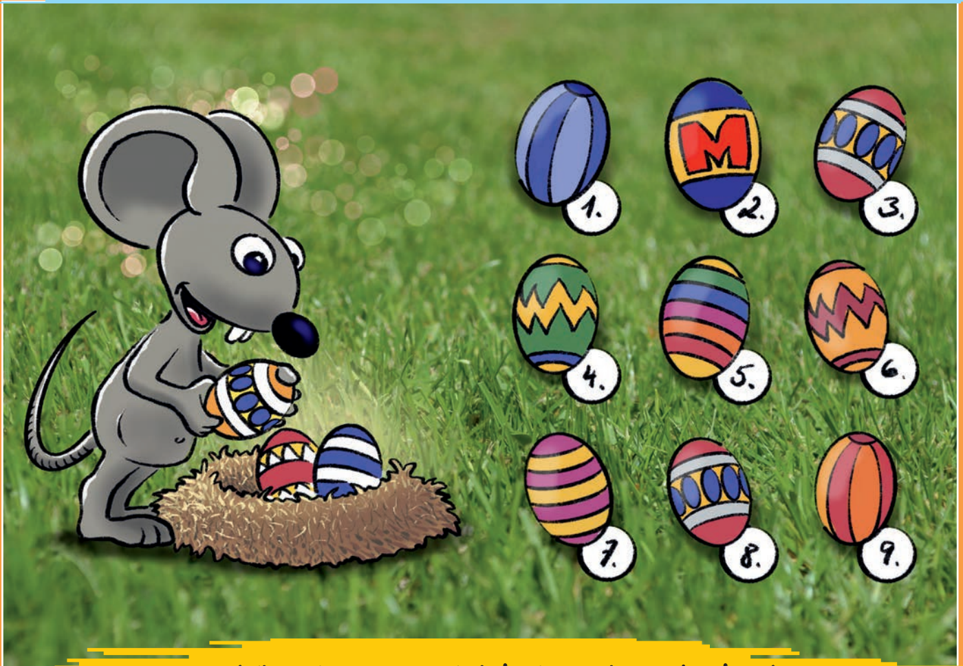
Illustration: Klaus Schürer

Jetzt habe ich ein großes Osternest mit bunten Eiern gefunden!