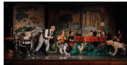
Detektivisches Mitmachkonzert: Die Bremer Stadtmusikanten brauchen Hilfe. Wer hat die Noten für das große Konzert?

Kinder sind neugierig und lieben Geschichten. In der Reihe „Kulturrausch für Kids“ gibt es im Frühjahr drei Veranstaltungen für die jüngsten Zuschauer. Spürsinn ist gefragt, wenn das Maruti Quintett und Jonathan Danigel am Donnerstag, 22. Februar, „Die Bremer Stadtmusikanten“ spielen. Bei diesem detektivischen Mitmachkonzert sind Esel, Hund, Katze und Hahn auf die Hilfe der jungen Zuschauer angewiesen. Die Kinder werden mit Bewegungs- und Rhythmusspielen in das Geschehen eingebunden.