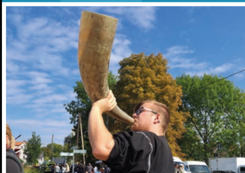
Mittelalterfest in Gernsbach