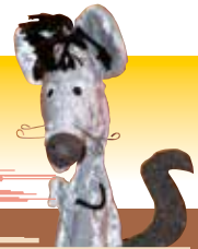
Illustration: Klaus Schürer