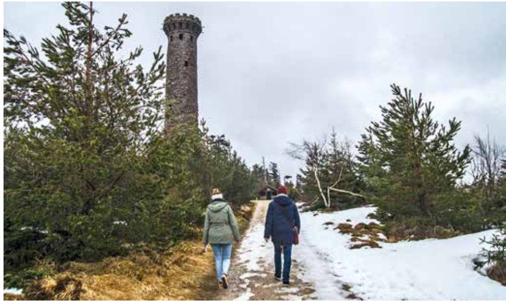
Spaziergänger an der Badener Höhe

Auf einer Tour mit den Rangerinnen und Rangern kann man mehr über den Nationalpark und einen respektvollen Umgang