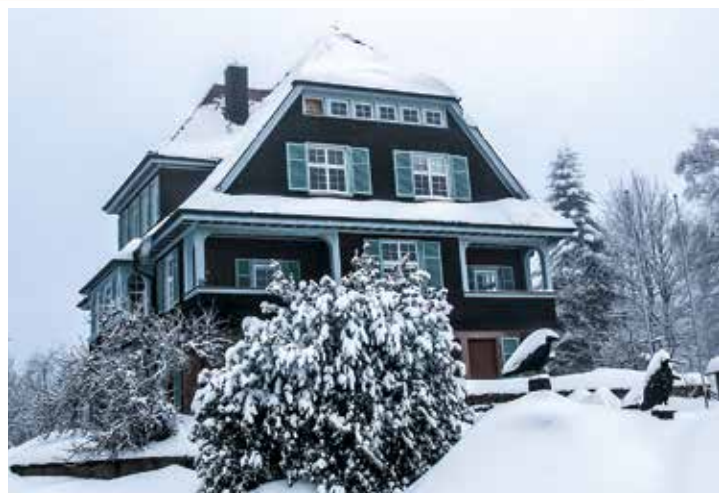
Historisches Gebäude Villa Klumpp, Hauptsitz der Nationalparkverwaltung

Der auf rund 900 Metern Höhe liegende Ruhestein ist der ideale Startpunkt für eine erste Erkundung des Nationalparks Schwarzwald. Im neuen Nationalparkzentrum Ruhestein stehen unsere Mitarbeiterinnen und Mitarbeiter für alle Fragen zum Schutzgebiet und für Tourentipps gerne zur Verfügung. Am Ruhestein haben zudem viele Veranstaltungen und Führungen ihren Ausgangspunkt, an denen man nach vorheriger Online-Anmeldung teilnehmen kann. Besonders schön an regnerischen Tagen: Mit der neuen, interaktiven Ausstellung zum wilder wer-