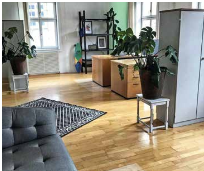
Coworking im Obergeschoss des Kornhauses

ferinnen und Helfern und großem Engagement einen Ort mit viel Platz für Ideen, Märkte und Workshops rund um das Gernsbacher Kornhaus. Nachdem die Corona-Pandemie das Generieren von Einnahmen ausbremste, gab das Kreativ Kollektiv schweren Herzens auf und legte seine Tätigkeit fürs Kornhaus nieder.