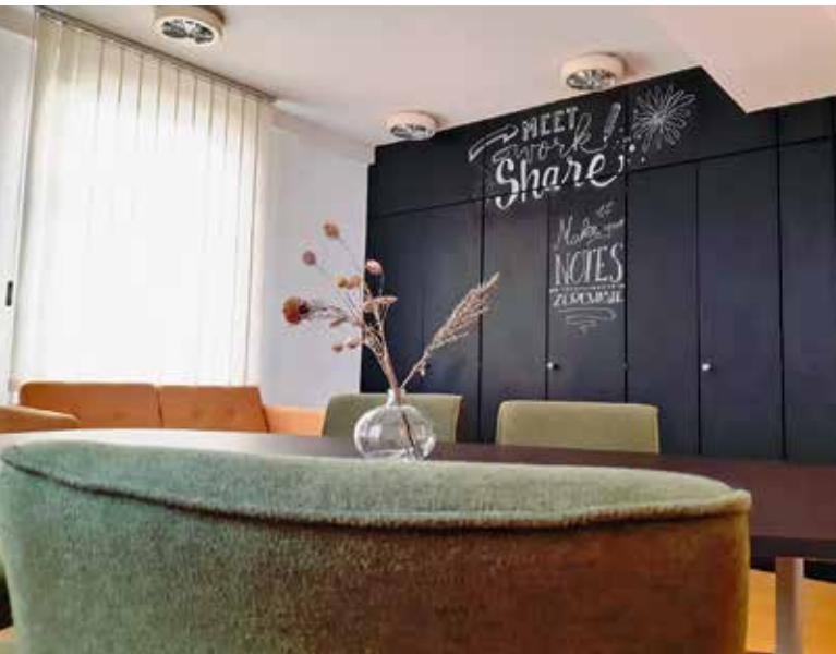
Meetingraum im Obergeschoss des Kornhauses

Unter dem Motto ‚Meet-Work-Share‘ schuf das Kreativ Kollektiv n.e.V. Ende 2019 gemeinsam mit zahlreichen ehrenamtlichen Hel-