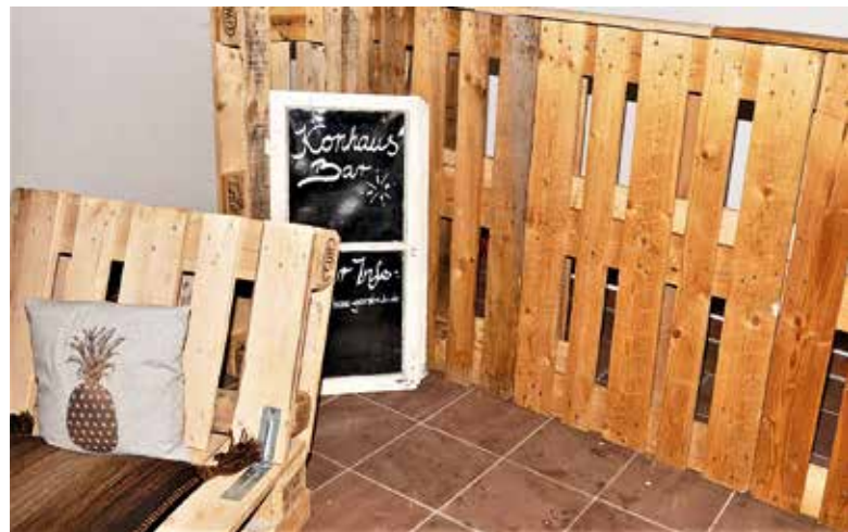
Das Erdgeschoss des Kornhauses lädt zu multifunktionaler Nutzung ein