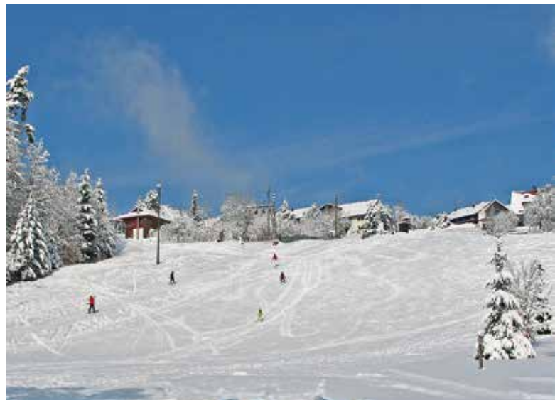
Skihang – Neue Äcker – (an der Wildbader Str.) – Bild: © isocont GmbH

Sonnenloipen (beim Parkplatz Jägerbrunnen) – Bild: © isocont GmbH