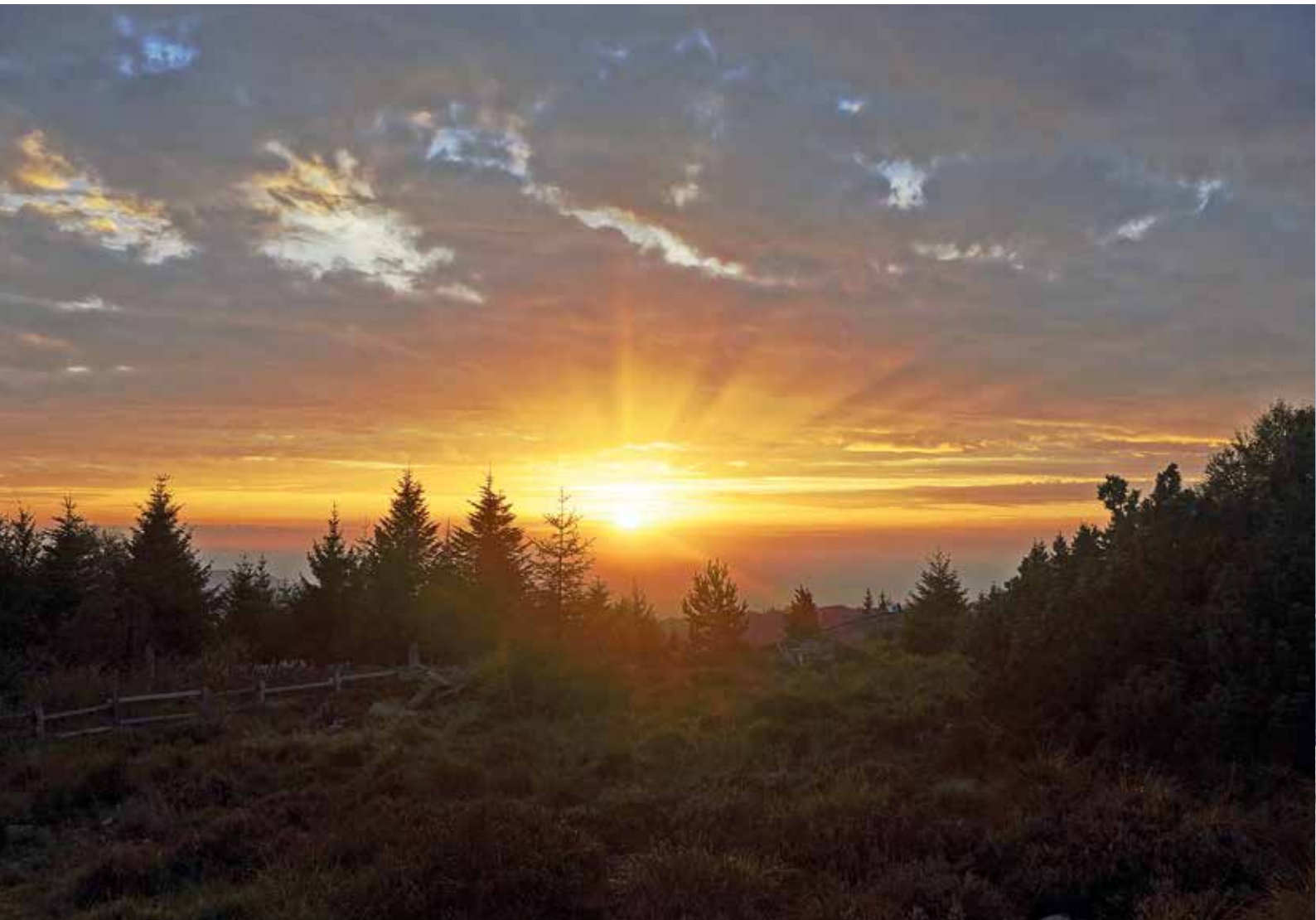
Sonnenuntergang am Schliffkopf – Bild: © Thomas Dobrzewski (Nationalpark Schwarzwald)

mit unserer Natur erfahren. Im Veranstaltungskalender auf der Webseite findet man die passenden Führungen. Und das neue Nationalparkzentrum ergänzt das Angebot mit einer spannenden, multimedialen Ausstellung über die Abläufe im natürlichen Kreislauf des Waldsystems.