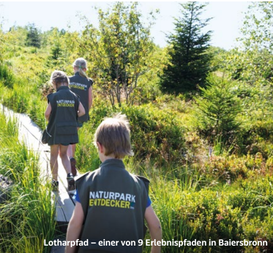
Lotharpfad – einer von 9 Erlebnispfaden in Baiersbronn

Aktuelle Informationen zu den Öffnungszeiten: rotherma.de Badstraße 9 | 76571 Gaggenau-Bad Rotenfels Tel.: 07225 97880