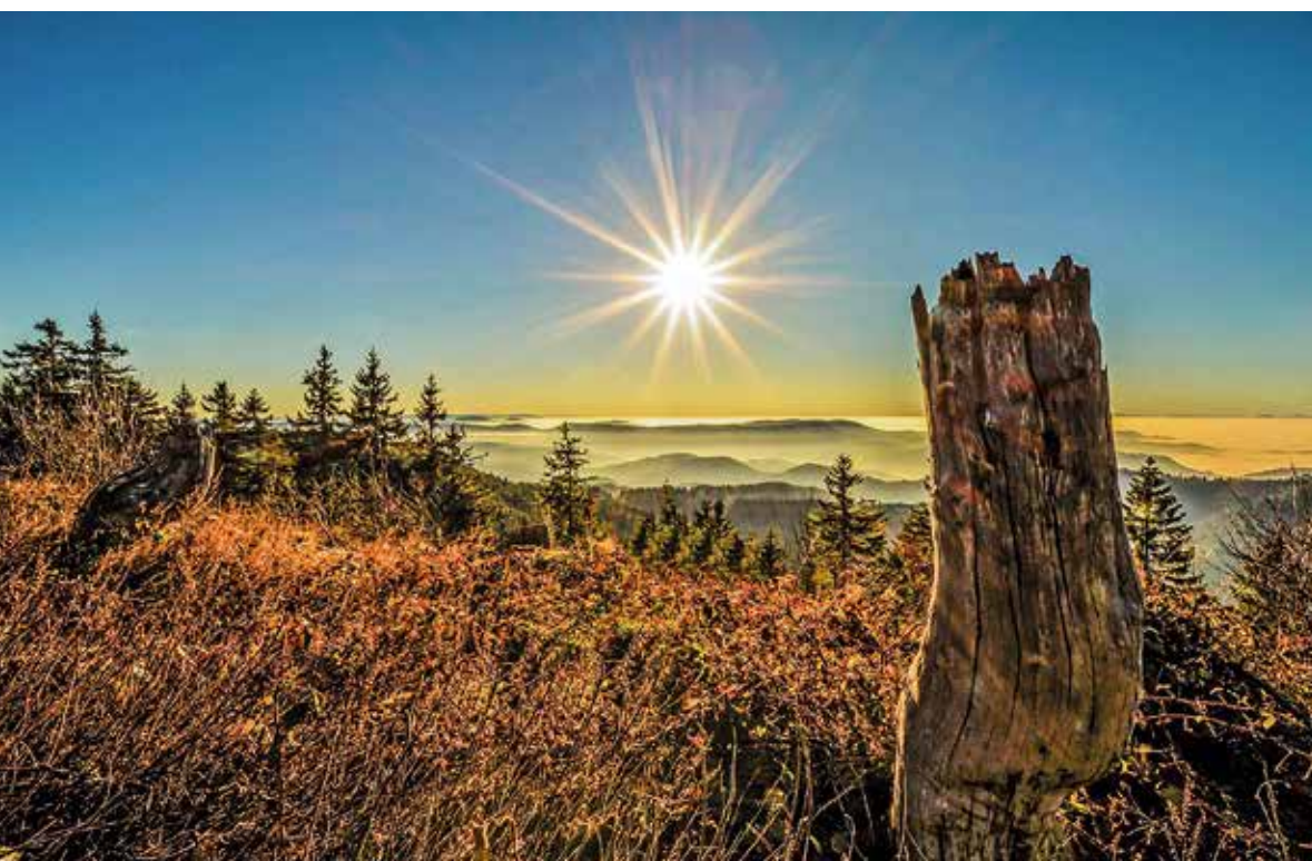
Grandiose Weitsicht auf dem Schliffkopf

abseits ausgetretener Wege mit dem Zelt mitten im Wald zu übernachten. Auch dies ist im Naturpark Schwarzwald Mitte/Nord ganz legal möglich, dank mittlerweile acht Trekking-Camps, in denen man für jeweils eine Nacht Station machen kann. Eines davon ist das Camp Schwarzenbach bei Forbach. Maximal drei Zelte mit je drei Personen finden dort Platz, eine Feuerstelle und ein Toilettenhäuschen bieten ein Mindestmaß an Komfort. Alles andere müssen die Camper selbst mitbringen – Abenteuer pur!