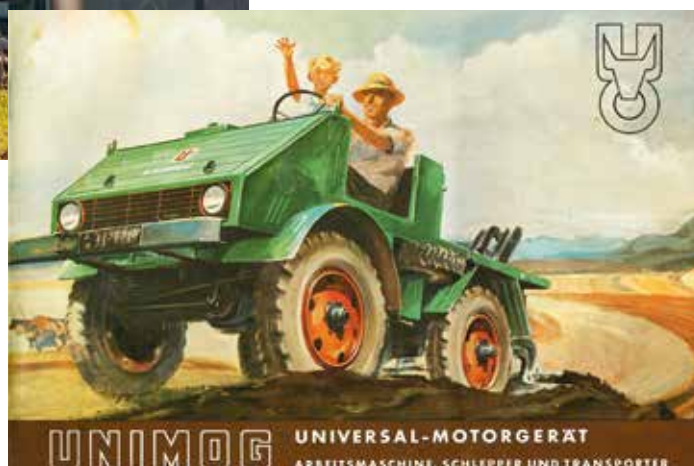
Der erste Werbeprospekt vom Unimog bei der Daimler AG 1951

Den Auftakt und Höhepunkt des Festes bildet ein Korso von 75 Unimog – vom fünften Prototypen von 1946 bis zum Unimog der allerneuesten Generation – vom LKW-Werk in Wörth zum Museum nach Gaggenau. Gegen 13 Uhr werden die Fahrzeuge am Samstag, dem 04. September im und am Museum erwartet, wo sie nach Baujahren und Baureihen geordnet zwei Tage lang bestaunt werden können. Darum herum gibt es ein vielfältiges Programm mit geführten Spaziergängen an den Fahrzeugen vorbei, Live-Musik und Fachvorträgen zum Unimog.