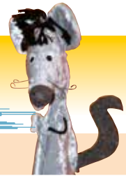
Illustration: Klaus Schürer