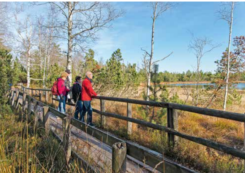
Am Wildsee auf dem Kaltenbronn

gesamten Naturerlebensraum Kaltenbronn nachhaltig weiterzuentwickeln und in seiner Einzigartigkeit zu erhalten.