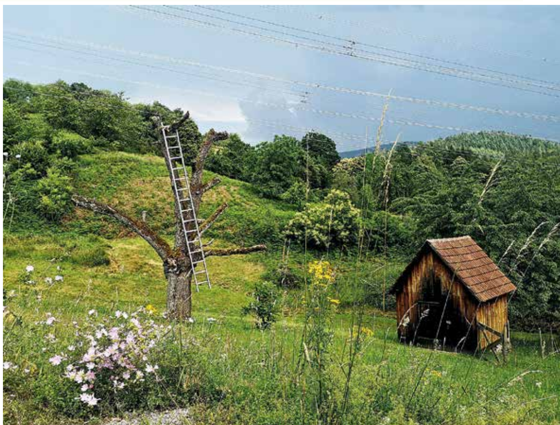
Auf kleine Entdecker warten rund um Weisenbach einige Überraschungen

Das Murgtal steckt voller Schätze. Der Naturpark Schwarzwald Mitte/Nord führt Sie hin!