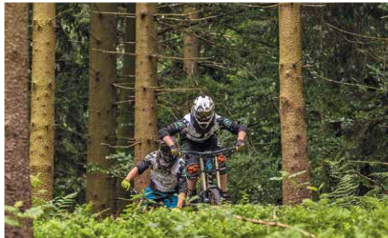
Mit dem Mountainbike unterwegs

Superlative beschreiben den Kaltenbronn: Das höchstgelegene Hochmoor Deutschlands ist auch größtes Bannwaldgebiet sowie größtes zusammenhängendes Waldgebiet Baden-Württembergs und zugleich sein erstes Naturschutzgebiet. Die einzigartige Landschaft zwischen Murg- und Enztal bietet seltenen Pflanzen und Tieren wie dem Auerhuhn oder der Kreuzotter einen Lebensraum. Das urtümliche Wildseemoor hat zu jeder Jahreszeit seinen ganz eigenen Charme und auch das Freizeitangebot ist sommers wie winters reizvoll und vielseitig. Neben weitgehend barrierefreien Wanderwegen, einem Rotwildgehege und Themenpfaden für Groß und Klein wie Trollpfad oder Auerhahnsteig, erwarten Sie auch Loipen, ein Schlittenhang und ein Skilift. Und das Infocentrum. In einer interaktiven Dauerausstellung werden hier Flora und Fauna, Landschaft und Geschichte der Region und des Schwarzwalds für die ganze Familie multimedial erlebbar gemacht. Der Naturpark Schwarzwald Mitte/Nord plant den